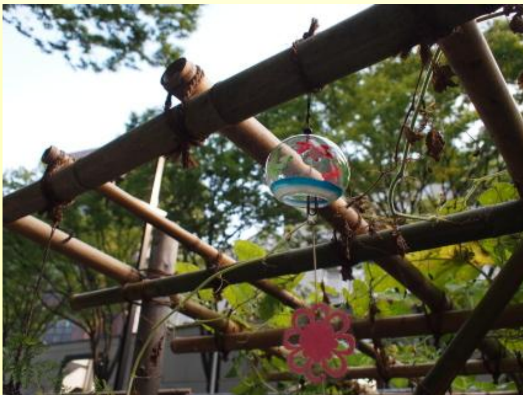
東京都文京区 「小石川後楽園」 (2012.9)