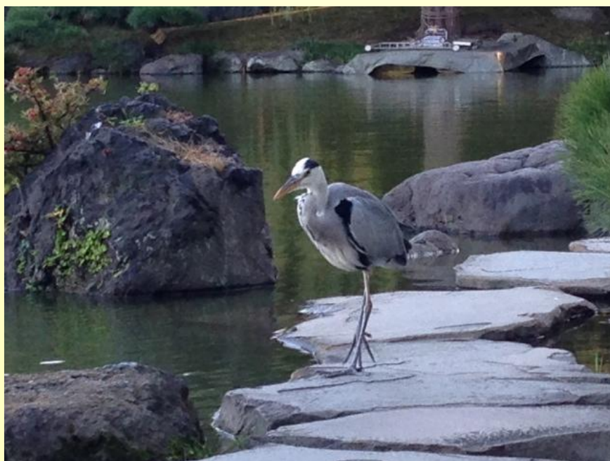
清澄庭園にて (2013.10 撮影：古谷)