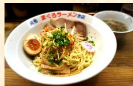
(上記写真はお借りしたものです)

続いて駅の南東側には『縁切り榎』という大層な名前の木があるということで行ってみました。駅から3分程の所にあるのですが住宅街にあり、少し場所が分かりづらいです。こちらの榎は江戸時代より悪縁を切りたい時や断酒を願う際、その樹皮を煎じて相手に飲ませると成就するとされています。現在では『縁切り榎』として参拝者が数多く訪れるそうです。日中に男一人で参拝していると周りの目が気になりますが、中に入ってみると沢山の絵馬が吊るされています。悪縁はございませんが良縁を結んでくれますようにとお祈りしました。